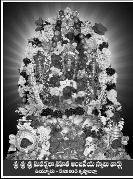
శ్రీ శ్రీ శ్రీ సువర్ణలా సహిత ఆంజనేయ స్వామి వార్లు ఉయ్యూరు - 521165 కృష్ణాజిల్లా